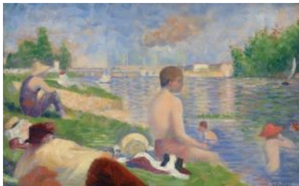
"Les Baignade, Asnières", 1883