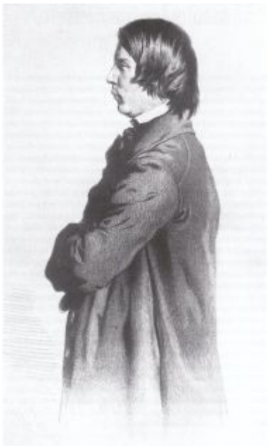
Robert Schumann im Jahr 1847

Wie bereits erwähnt, beginnt Schumanns Konzert mit einem markanten Anfangsakkord, der fast schon in Beethovenscher Anspruchshaltung daherkommt. Danach gleitet die Musik jedoch in ruhigeres Fahrwasser und präsentiert weit geschwungene Themen, in denen von Anfang an Orchester und Solo-Instrument eng miteinander verzahnt sind. Dieser erste Satz entstand schon früh als eigenständige Fantasie, es gelang Schumann jedoch nicht, diese Fantasie an einen Verleger zu verkaufen. Erst nach der Erweiterung zu einem dreisätzigen Klavierkonzert fand dieses Werk seinen erfolgreichen Weg auf die Konzertbühnen.